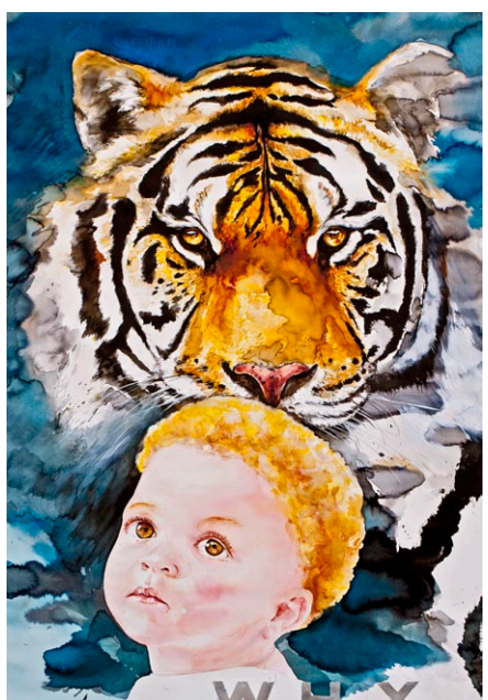
"Why", 2012, 145 x 95 cm, watercolor