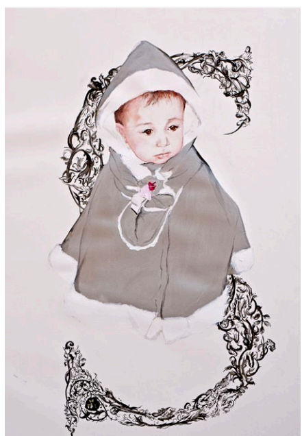
"Why", 2012, 145 x 95 cm, watercolor