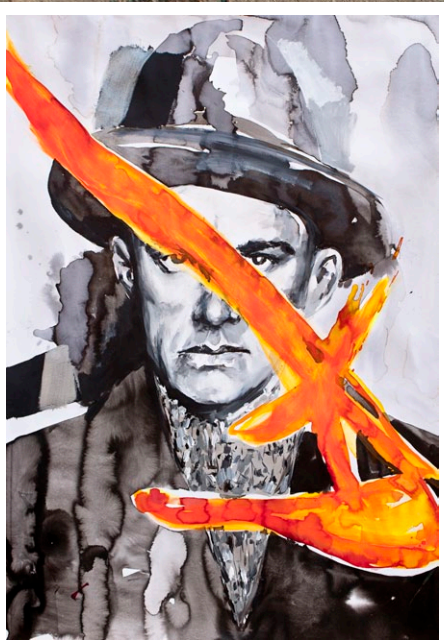
"Mayakovsky I", 2012, 100x70cm watercolor and acrylic