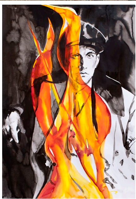
"Mayakovsky II", 2012, 100x70cm watercolor and acrylic