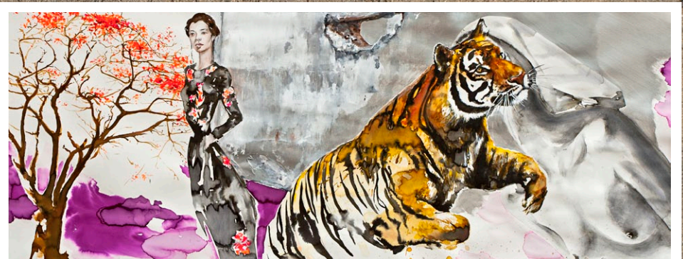
"Untitled", 2012, 70x180cm, watercolor and acrylic