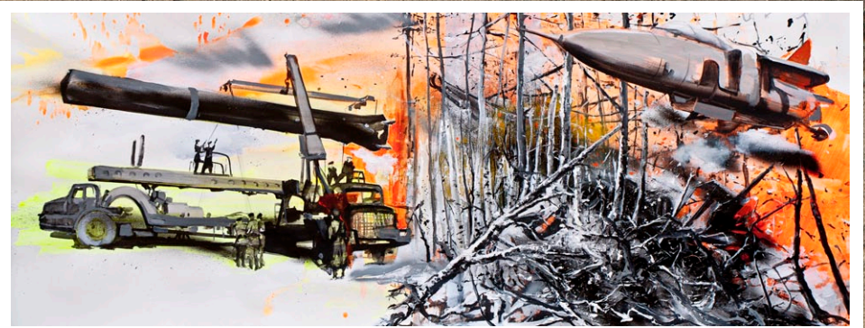
"Farewell Taiga", 2012, 70x180cm, watercolor and acrylic